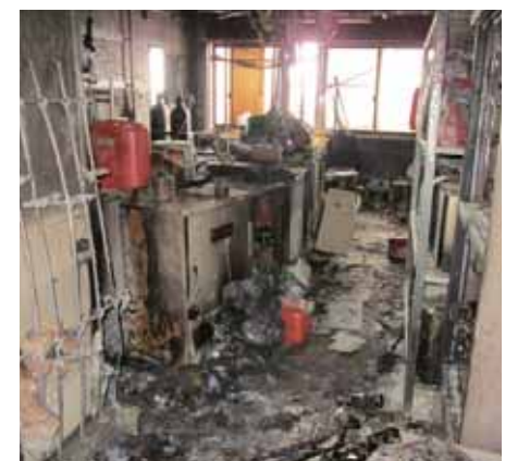
揺れによる化学実験室の火災跡（東北大学）