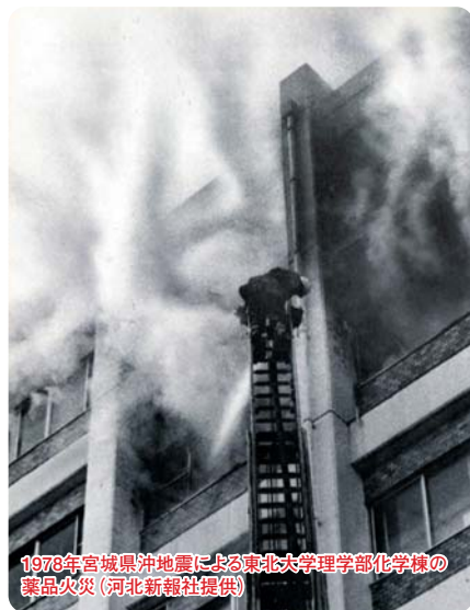
1978年宮城県沖地震による東北大学理学部化学棟の薬品火災