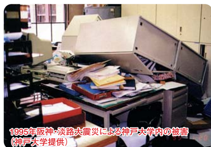
1995年阪神・淡路大震災による神戸大学内の被害